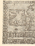
Рад Дасосана Чиприза (око 1820 — 1864)

посткума) обележава, то уп убује на могућност установљена још једне станице музичке манифестације: ФЕСТИВАЛ српске духовне хорске песме. Овај предлог захтева и основно обрадање. Па, ево га: