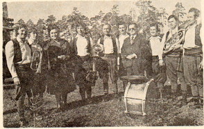
Незабораван сурет са Јосипом Брозом Титом

броначиком летимх играма. И телевизијска публика је често била у прилици да ви- ди и чује музичаре оних момака. Популарност је не- сумњива, што сведочи и из- давана шест симби и четри- наест поит плејбокс а у при- приреди је и издавање вели-