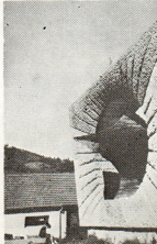
Гуча: Споменник Драгачевцима палим у НОР у