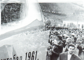
Скупило се и старо и младо...