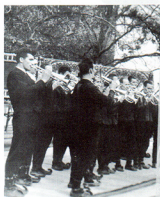
„Са Овчара и Каблара“ из свих труба