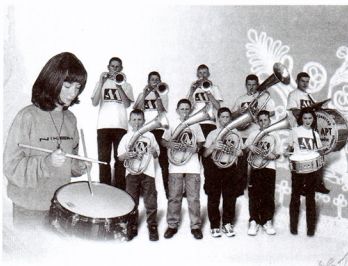
„Знаш ли, драга, ону шљиву ранку?“ – питају музиком млади трубачи из Коштунића.

Нихова химна је песма „Знаш ли, драга, ону шљиву ранку“, што је печат краја из кога долазе. Читав суворорски крај је препун шљива, а производи ма од шљиве са омавом подручја нема пенцица у свету. Боримо се да и ова деца када још порасту и стасају у трубачком музичарињу бити бек земаља. У њиховом репер-