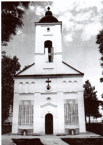
Сведок времена: Црква у Гучи

У доњој зони иконостаса су цркве двери. На њима су иконе овалног облика. Средњим долом заузима представа Благочељности док су левом и десном предствалени у четири медаљона, симетрично распоређена на дверима. Композиција од два медаљона са ликом Богородице на левој и арханђела Гаврила на десној страни иконостаса је у другој зони најважније композиције Великих празника. Света Троица приказана је по уобичајеној шеми, са симетрично распоређеним фигурама Христа, Бога оца и Светог духа. Преобра-