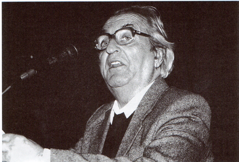
Бранко В. Радичевић: Нашао је своју боју за своје небо