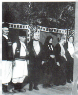
На позорници околине филмима разиграло се коло старца и старица