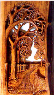
Остварење Зорана Копривице (дрво)