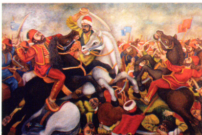
„Бој на Лопашу“ (уље)

Са својим делима учествовао је на свим саборима трубача и другим манифестацијама у Драгачеву. Излагао је сам или са Удружењем сликара и вајара Драгачева по многим градовима Србије, Југославије, али и у иностранству. Дела му се налазе по многим музејима, галеријама, државним установама и приватним кућама.